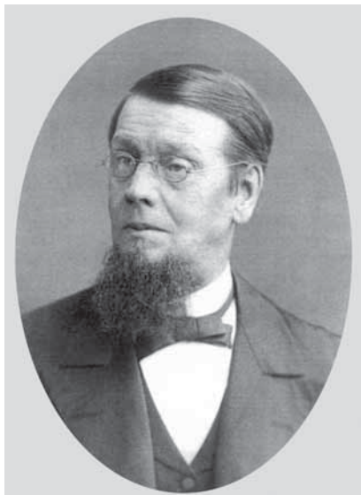
Карл Иванович Май (1820–1895) – основатель школы

Посвящается автору книги об истории школы Карла Мая Никите Владимировичу Благово