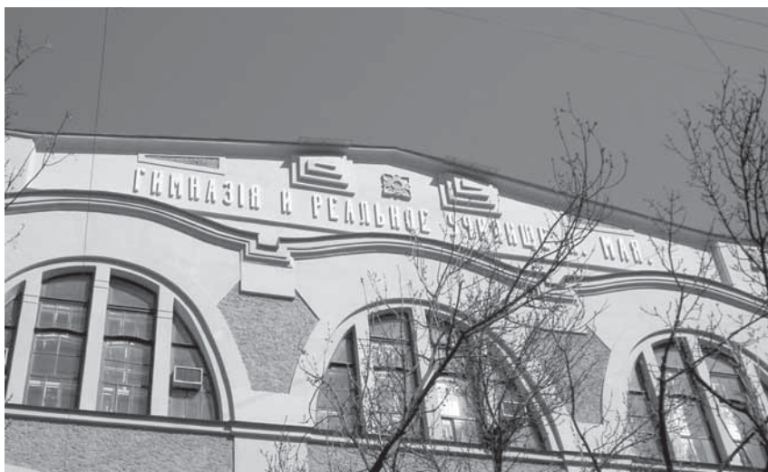
Фасад здания школы с отреставрированной исторической надписью. 2009 г.