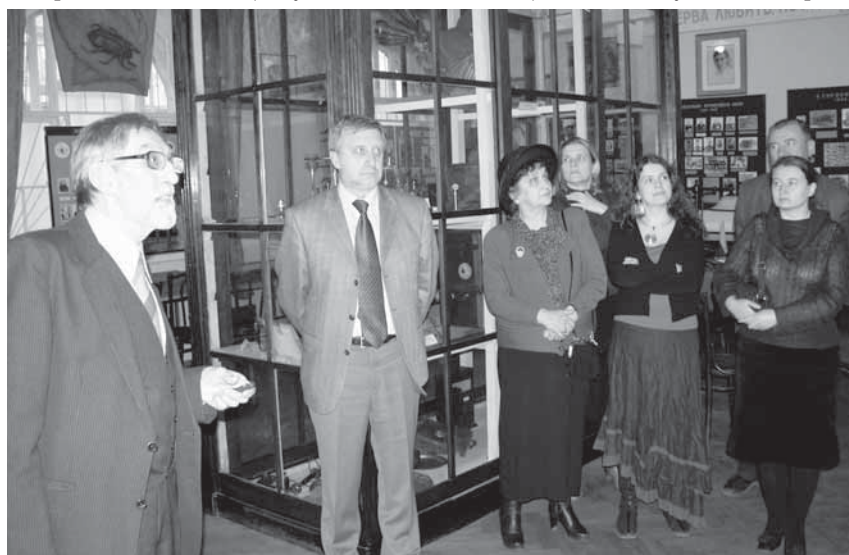
Встреча с сотрудниками Международного благотворительного фонда имени Д. С. Лихачева 4 мая 2007 г.