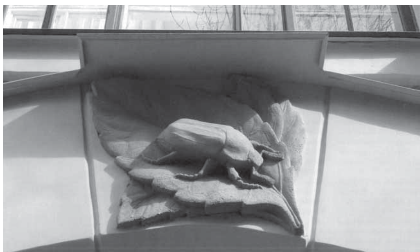
Фасад здания школы с восстановленным майским жуком – эмблемой школы К. Мая. 2009 г.