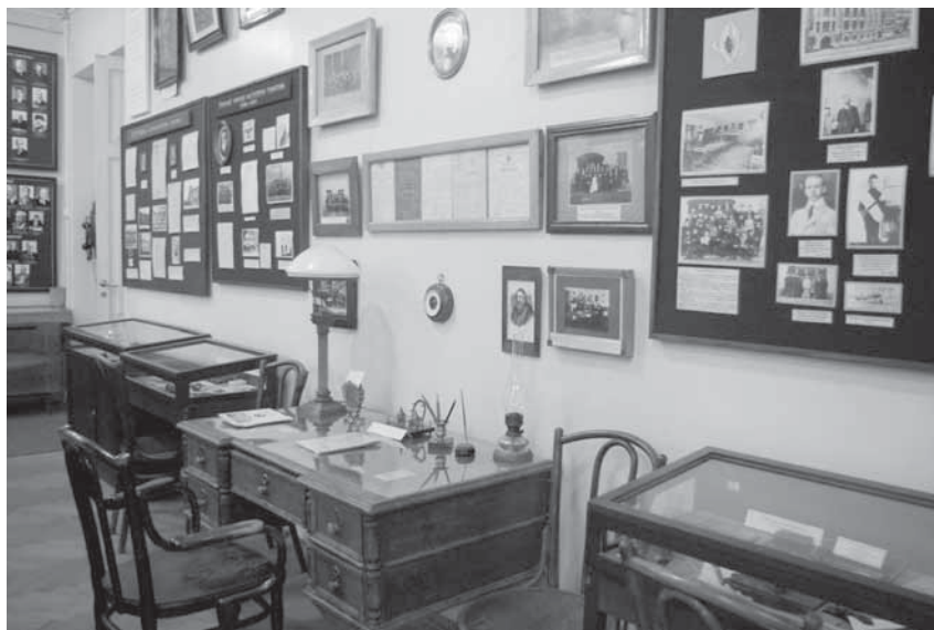
Интерьер главного зала музея школы Карла Мая. Фото М. Т. Валиева. 2008 г.