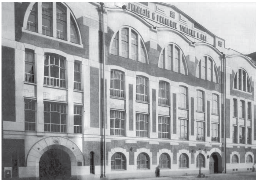
Здание гимназии и реального училища К. Мая. Фото 1913 г.