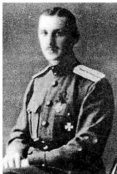
Кавалергард Г. С. Воеводский

и судостроительной отрасли, а его автор в 1904 г. был произведён в капитаны I ранга и принял командование крейсером «Герцог Эдинбургский». Через два года, в мае 1906 г., Степан Аркадьевич был назначен командующим учебным отрядом Морского кадетского корпуса 5 , а затем директором Морского корпуса и начальником Николаевской Морской академии 6 . С 1909 по 1911 г. С. А. Воеводский занимал пост морского министра Императорского флота России 7 .