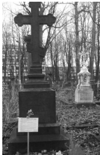
Могила адмирала А. В. Воеводского на Смоленском православном кладбище

Род адмиралов Воеводских идёт от Даниила Ильича , к которому перешли фамильные земли в Бельском уезде 2 .