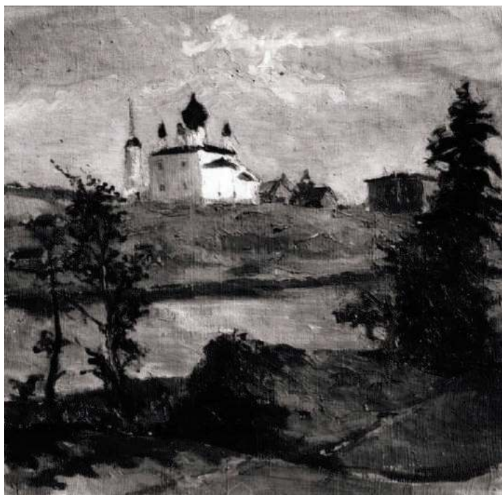
Я.М. Шур. Старая Ладога. Холст, масло.