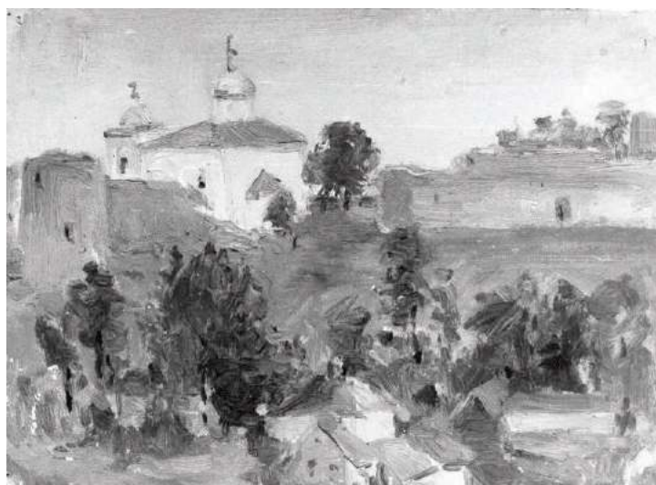
Я.М. Шур. Изборск. Холст, масло.