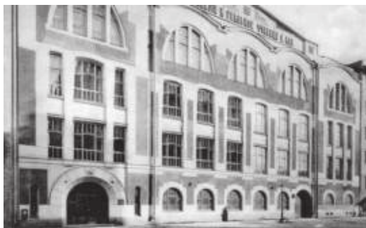
Гимназия Карла Мая. Фото 1914 г.

эта школа давала образование нескольким поколениям одной фамилии.