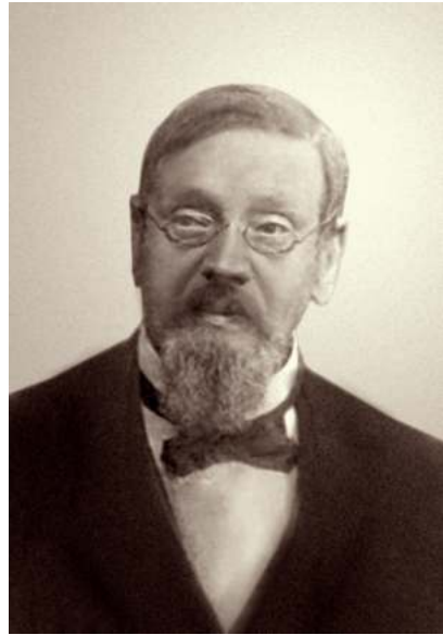
Карл Май. Фото 1880-х гг.

Состав учащихся, как по социальному положению, так и по национальной принадлежности, был весьма разнообразен. Но следует подчеркнуть, что здесь, без какой-либо дискриминации, учились дети швейцара и слесаря вместе с сыновьями князей Гагарина, Голицына, графов Олсуфьева и Стенбок-Фермора, баронов Корф, Тизенгаузена и Штакельберга, представители семей предпринимателей Варгуниных, Дурдиных, Елисеевых, Торнтонов и потомки либеральной интеллигенции — Бенуа, Гриммов, Добужинских, Рерихов, Римских-Корсаковых, Семёновых-Тян-Шанских, причём, во многих случаях,