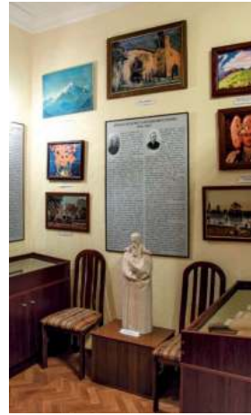
Экспозиция «Семья Рерихов в гимназии К. Мая». Фото 2009 г.

Хронологически следующий период — 1937-1942 годы — посвящён Шестой специальной артиллерийской школе. Персональные экспозиции, содержащие бесценные личные вещи, посвящены генерал-майорам В. В. Волкову и В. Г. Рожкову, майору И. Р. Миркину и сержанту Е. М. Карлову, боевая карта г. Бреслау (Вроцлава). Отдельный раздел составляют относящиеся к трагическим дням блокады фотографии, открытки, афиша, репродуктор «чёрная тарелка», метроном, продуктовые карточки, карта Васильевского острова с указанием мест разрушений. Тему Великой Отечественной войны дополняет открытый 7 мая 2015 г. в вестибюле здания стенд «Они погибли в боях за Родину», на котором размещены 60 фотографий спецшкольников, отдавших свою