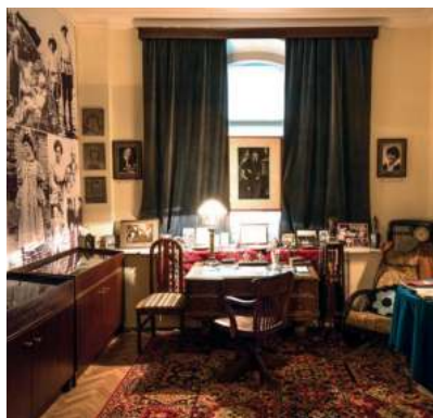
Экспозиция «Д. С. Лихачев и его семья». Фото 2009 г.