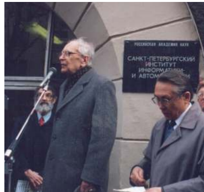
Академик Д. С. Лихачев выступает на открытии Музея 12 мая 1995 г.