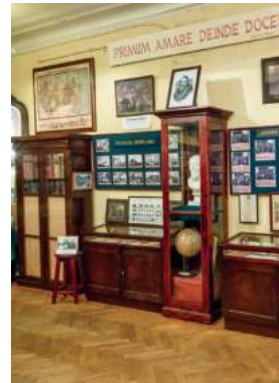
Зал истории Школы К.Мая. Фото 2007 г.