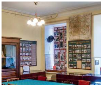
Экспозиция о послевоенной школе.

В экспозиционное пространство вошел и коридор, ставший аванзалом Музея. Здесь размещены книги и журналы, в которых опубликованы статьи, относящиеся к истории школы, стенды, посвященные первым послевоенным выпускам 1948 и 1949 гг., а также выставка, отражающая этапы развития вычислительной техники — от дореволюционных счётов до предтечи современных компьютеров.